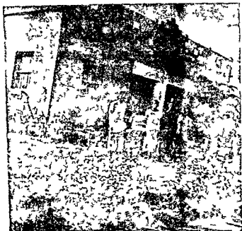
मनफर का सर्वोदय आश्रम

श्रीर अन्य चार-पाँच कार्यकर्ता इस गाँव को केन्द्र मानकर मनफर के पूरे क्षेत्र में घूमते रहते हैं। ये लोग गाव के